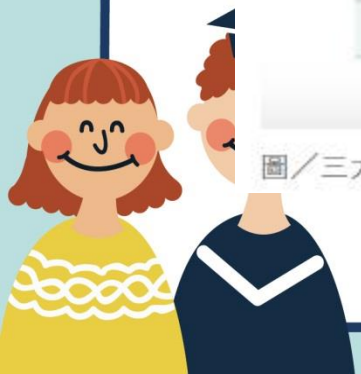
圖／三大產業雇主認定最佳畢業生TOP10